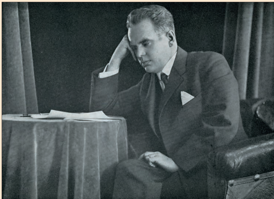
Průmyslník, který nezná oddechu, nad novými úkoly

Tvrď a neradostný byl život obyvatel Studence před založením továrny. Od roku 1910 je osud obce spjat s osudem závodů a to k jejímu prospěchu. Hvězda úspěchu, která září nad továrnou, je dobrou hvězdou celé obce.