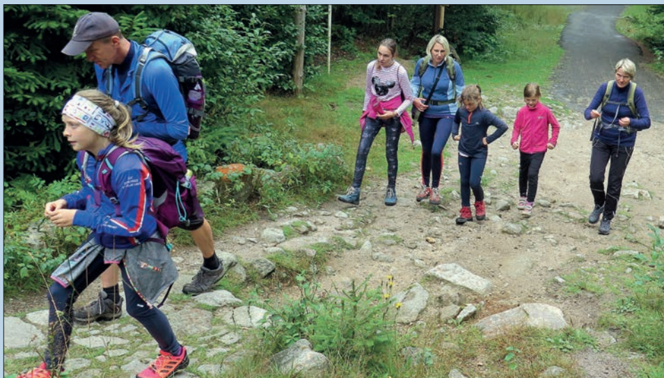
Cesta Labským dolem

Závodní skupina má náročnější přípravu a 15 dětí (ročník 2005–2009) trénuje třikrát v týdnu. Nejdůležitější bude start na Mistrovství ČR žactva v běhu na lyžích ve Vysokém nad Jizerou v termínu 28. února až 1. března 2021 a v závěru zimy v termínu 20. až 22. března 2021 finále soutěže Hledáme nové talenty v Novém Městě na Moravě. Při krajských pohárových závodech budeme usilovat o umístění v první šestce družstev v Libereckém kraji.