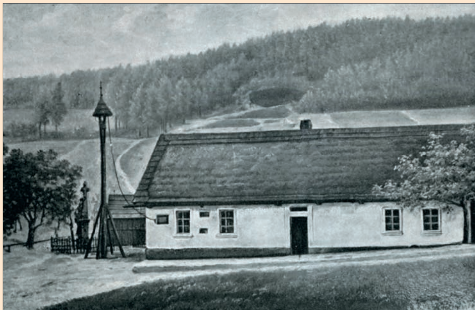
Rodný domek továrníka Jana Fejgara

A v tomto domku, kde vroucí zbožnost a svatá trpělivost prosté české maminky dovedla se přenést přes smrt pěti milovaných