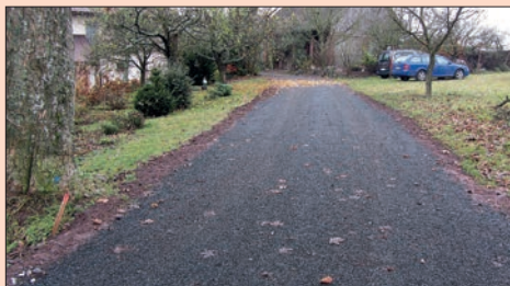
↑↓ Oprava cesty u č. p. 127