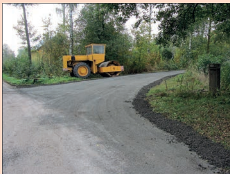
↑↓ Oprava cesty u rybníka